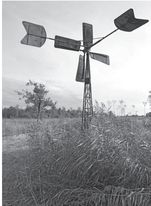
Molentje in de Weerribben

Voel je je aangesproken, herken je je in die passie en wil je weten wat het betekent om kandidaat te zijn voor Water Natuurlijk DOD? Nou, dat komt mooi uit! Want Water Natuurlijk houdt op dinsdag 28 juni 2022 een webinar voor alle PvdA-leden van de afdelingen Overijssel en Drenthe.